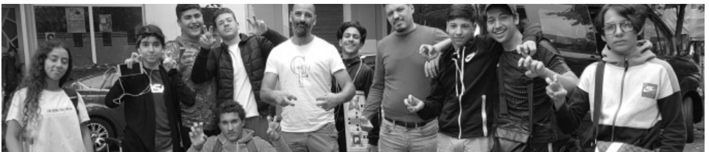
La Cité de Jeunes - Chaussée de Forest 181 à 1060 Bruxelles

Du 29 juillet au 2 août, La Cité des Jeunes a réalisé un camp d'été avec un groupe mixte de 13 jeunes âgés de 15 à 24 ans dans le petit village de Xhoffraix situé dans la commune de Malmedy. Les jeunes ont eu la possibilité de participer à différentes activités à caractère ludique, coopératif et de découverte de la nature. Dans le cadre de la continuation d'un atelier de construction de jeux vidéo concrétisé durant l'année académique, les jeunes ont eu également l'opportunité de découvrir, pour la première fois, les enjeux de la réalité virtuelle.