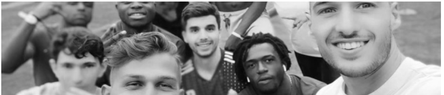
La Bibi - Rue Lamarck 26 à 4000 Liège

Les jeunes de la MJ La Bibi se sont mis en action lors du stage sportif du 16 au 20 juillet inclus. Ils ont réservé plusieurs chalets dans le village de vacances de Worriken à Butgenbach, près de la frontière allemande. Au programme : 4 jours de soleil, d'activités collectives et de bonne humeur !