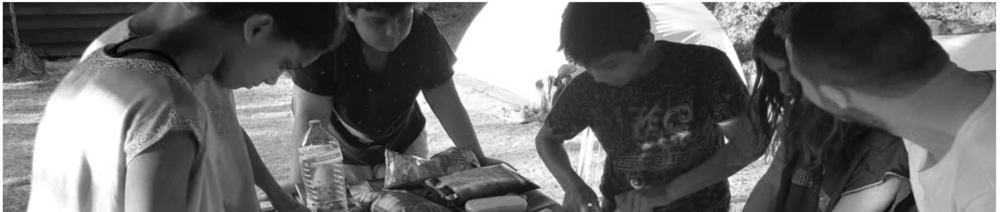
Les Balances - Rue des Bosquets 38 à 5000 Namur