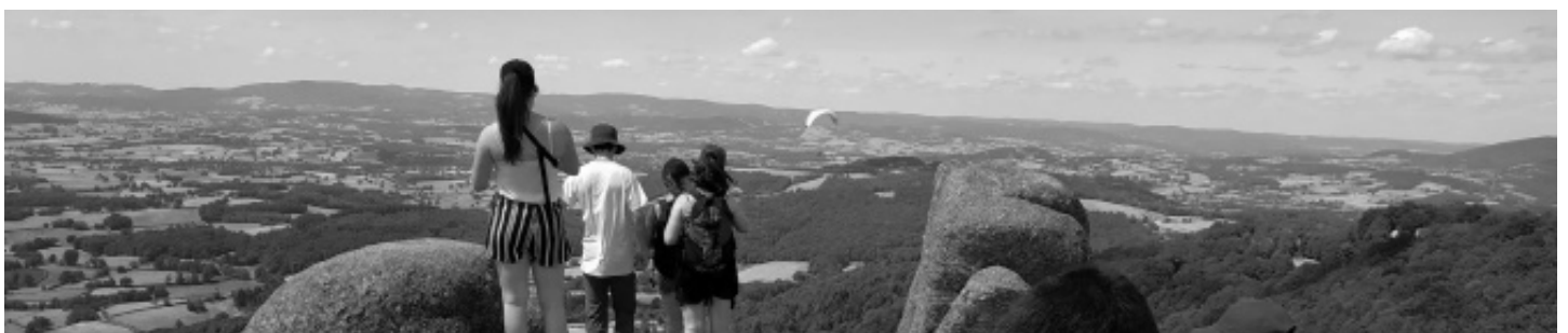
MJ D'Arлон - Rue de la Caserne 40 à 6700 Arlon

Cela fait 12 ans que je fais ce métier et c'est la première fois que je vis une expérience aussi riche et forte en émotions ! »