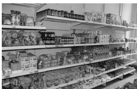
Des produits variés et de qualité ▲