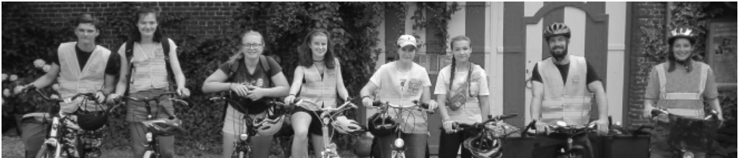
La Prairie - Rue de la Vellerie 121 à 7700 Mouscron

C'était le troisième camp du genre. Il a réuni 50 jeunes et animateurs de 5 fermes européennes (Italie, Norvège, Allemagne et Belgique) du 21 au 28 juillet. Les premières éditions avaient eu lieu à La Prairie en 2017 puis en Allemagne en 2018. Cet été, le groupe a été accueilli par la ferme « Bokkeslot » de Deerlijk. Les jeunes de la MJ s'y sont rendus à vélo. Il a d'ailleurs été question de mobilité douce et de « slow food » durant tout le séjour. Chaque participant avait en effet un vélo à disposition pendant tout le camp dont le programme mêlait visites, activités citoyennes et créatives.