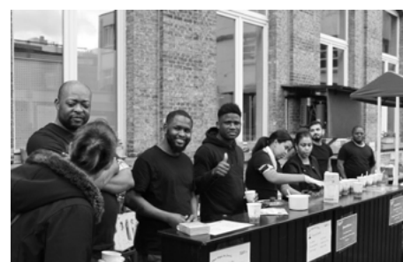
Une équipe disponible, souriante et dynamique soutenue par des partenaires fiers du travail accompli ▲

Nichée dans la discrète cour intérieure d'une ancienne école primaire, l'épicerie sociale des Capucines, située en plein cœur du quartier des Marolles, accueille chaque semaine des centaines de clients moins fortunés depuis maintenant plus de 15 ans.